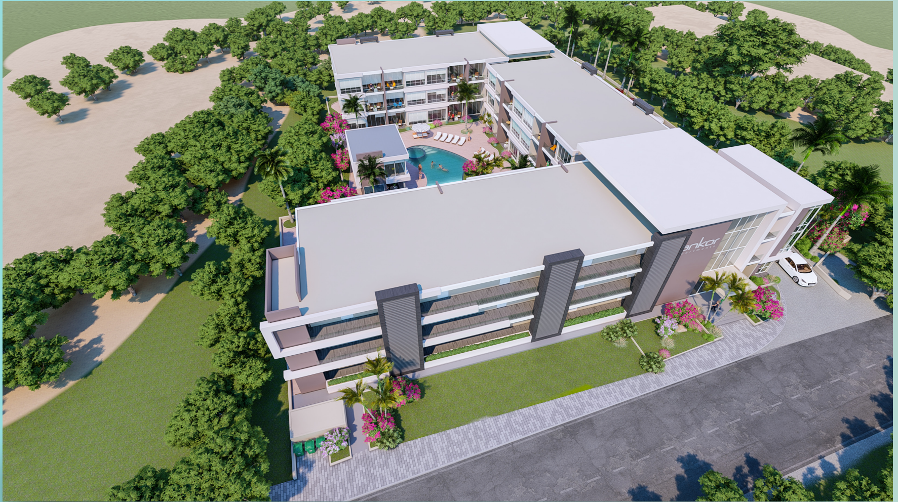
▼ VISTA AÉREA